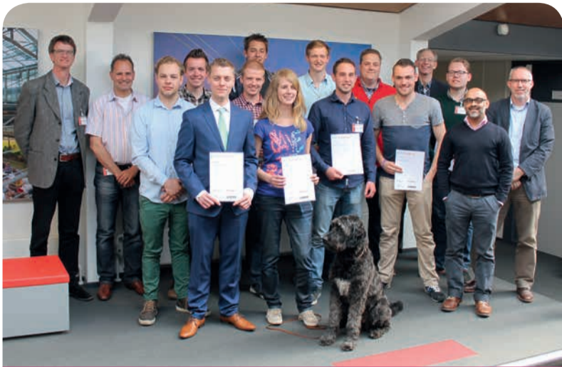
Studenten en docenten tijdens de certificaatuitreiking