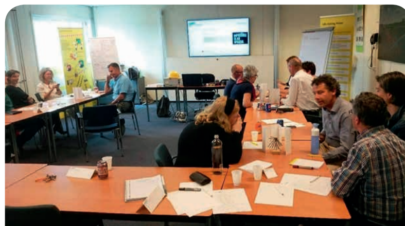
Workshopbijeenkomst Veiligheidsbewustzijn: 'Wat kunnen we leren van andere branches?'

RIO heeft diverse acties in gang gezet. Als eerste zijn tijdens interne sessies alle RIO-medewerkers op de hoogte gebracht van de nieuwe koers en zijn enkele kernteams geformeerd. Opleiders uit elk vakgebied passen de opleidingen drastisch aan zodat